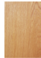
突板サンプル A4 サイズ 1 枚